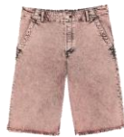
SHPBE00049 E23BLEACH SHORT 175€ / 118€ €199 / £134