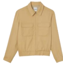
SHPBL00800 E23FITIES 345€ / 232€ €389 / £261