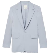
SHPVE00768 E23FORMAL SKY BLUE 475€ / 319€ £469 / £315