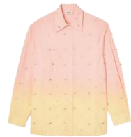
SFPCM00838 E23ARICIE 265€ / 178€ €299 / £201