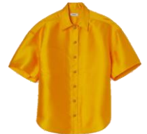
SFPCM00682 H22JUNE 245€ / 165€ €279 / £187