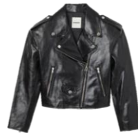
SFPBL00749 E23JILLAN 565€ / 379€ €629 / £422