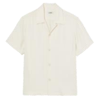
SHPCM00822 E23REQUIN MC 185€ / 124€ €209 / £141