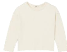
SHPTR00447 E23BOUCLE 245€ / 165€ €279 / £187