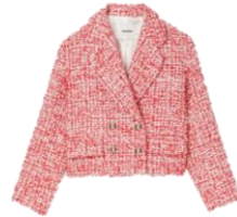
SFPVE00796 E23AVILA 385€ / 258€ €429 / £288