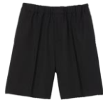
SHPBE00058 E23LAGUNA 175€ / 118€ €199 / €134