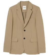
SHPVE00776 E23UNSTRUCTURED BEIGE 475€ / 319€ £469 / £315