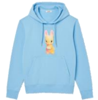
SHPSW00571 E23BUNNY HOODIE 195€ / 131€ €219 / £147