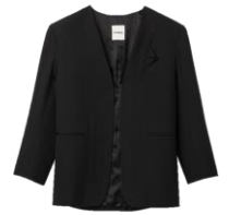
SFPVE00803 E23BILBAO 425€ / 285€ €469 / £315