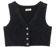
SFPPU01770 E23MICHOU 165€ / 111€ €179 / £120