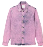
SHPBL00758 E23BLEACH OVERSHIRT 255€ / 171€ €289 / £194