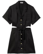
SFPRO02723 E23JULIENNE 285€ / 191€ €319 / £214