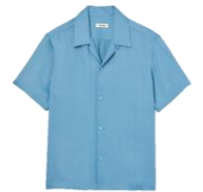
SHPCM00822 E23REQUIN MC 185€ / 124€ €209 / £141