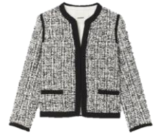
SFPVE00798 E23AUGUSTINE 375€ / 252€ €419 / £281