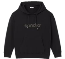
SHPSW00554 E23RETRO HOODIE 185€ / 124€ €209- / £141