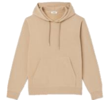
SHPSW000458 E23SANDRO HOODIE 185€ / 124€ €209 / £141