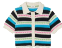
SFPCA00788 E23INDIA 225€ / 151€ €249 / £167