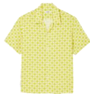
SHPCM00855 E23CROSS MC 185€ / 124€ €209 / £141