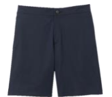
SHPBE00054 E23SIGMA SHORT 165€ / 111€ €179 / £120