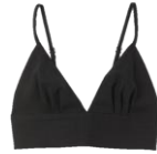
SFPTO00517 E22CANNES 95€ / 64€ €99 / €67