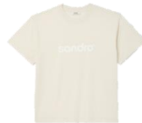
SHPTS01187 E23RETRO TEE 95€ / 64€ €99 / £67