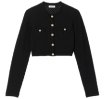
SFPCA00725 E23AUVENT 195€ / 131€ €219 / €147