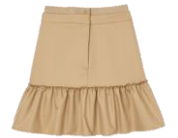
SFPJU00779 E23ALICANTE 175€ / 118€ €199 / €134