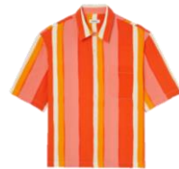
SHPCM00821 E23STRIPES MC 195€ / 131€ €249- / £147