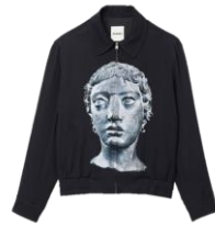
SHPBL00762 E23TESTA JACKET 395€ / 265€ €439 / €295