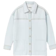
SFPCA00806 E23GWENDY 275€ / 185€ €309 / £208