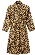
SFPOU00534 E23STORMY 525€ / 352€ €589 / £395