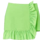
SFPJU00781 E23MARLENE 165€ / 111€ €179 / €120