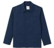
SHPBL00752 E23WORKER TWILL 325€ / 218€ €359 / €241