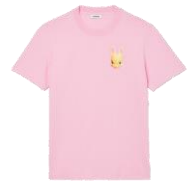
SHPTS01219 E23BUNNY TEE 95€ / 64€ €99 / £67